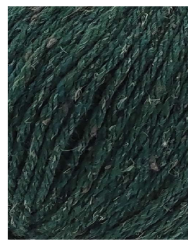
63 Verde Green