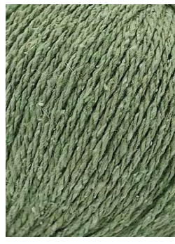
64 Verde Claro Sage