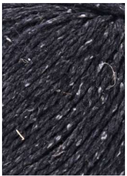
58 Gris Oscuro Dark Gray