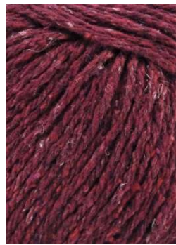
54 Granate Garnet