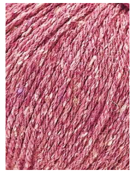
66 Rosa Pink