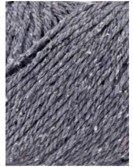
57 Gris Claro Light Gray