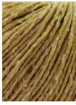
62 Trigo Wheat