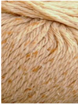
59 Vainilla Vanilla