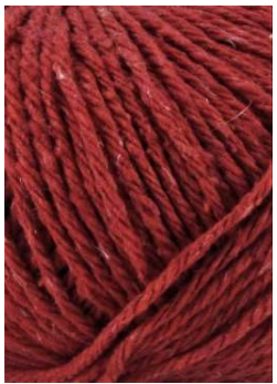
60 Rojo Oscuro Dark Red