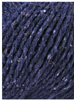
52 Marino Blue Navy