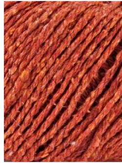
56 Caldera Copper