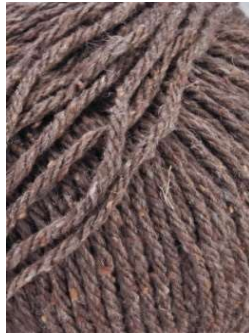
50 Marrón Brown