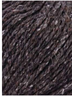
51 Piedra Stone