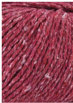
53 Fucsia Fuchsia