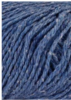
61 Azafata Royal Blue