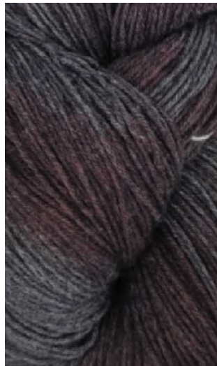
720 Azul Rosado Blue Pink