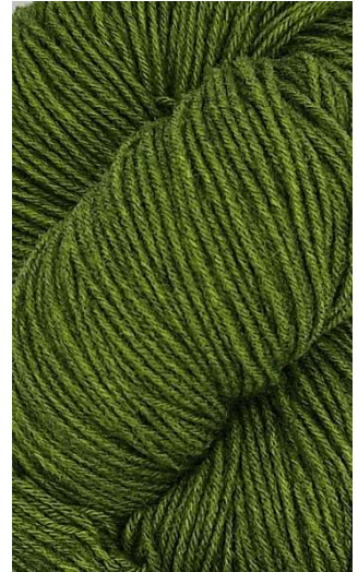
710 Oliva Olive