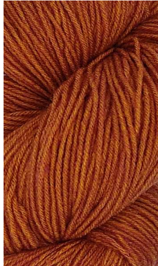
610 Naranja Quemada Burnt Orange