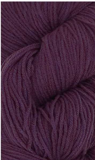
810 Púrpura Purple