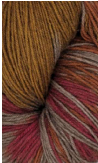
620 Ocre Rojizo Reddish Ocher