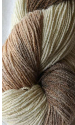
310 Multicolor Beige Multicolor Beige