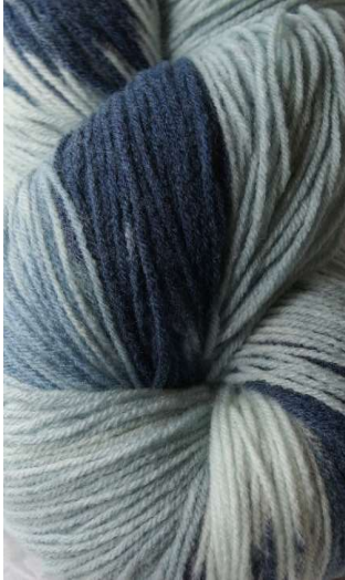
210 Multicolor Azul Multicolor Blue