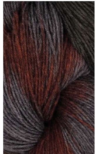
820 Gris Oxido Oxide Gray