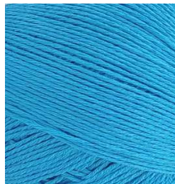
3063 Turquesa Turquoise