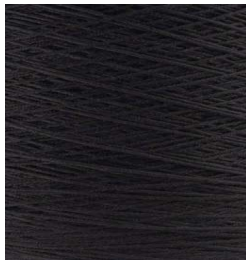
3019 Negro Black