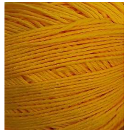
3060 Amarillo Yellow