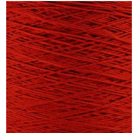
3010 Rojo Red