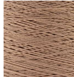
3050 Arena Sand