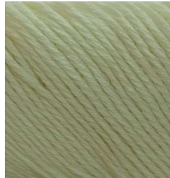
3020 Crudo Ecrú