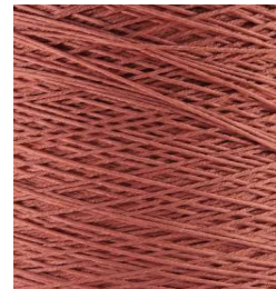
3054 Rosa Palo Antique Pink