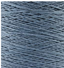
3052 Azul Blue