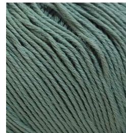
3055 Verde Salvia Sage Green