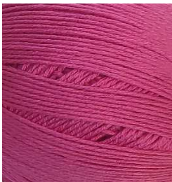
3061 Fucsia Fuchsia