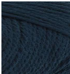
3018 Azul Marino Blue Navy