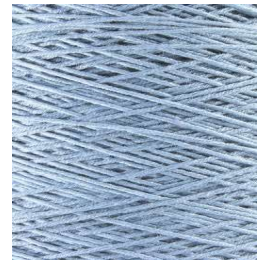
3051 Azul claro Light Blue