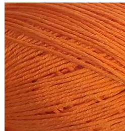
3064 Naranja Orange