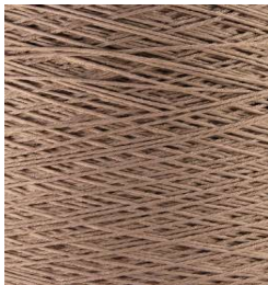
3057 Topo Taupe