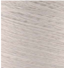
3001 Blanco White