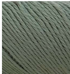
3045 Gris Gray