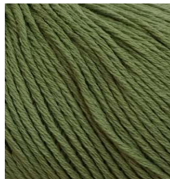
3056 Verde Green