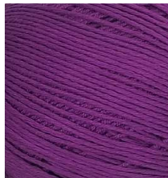
3062 Morado Purple